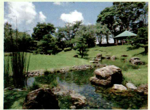
浜北区万葉の森公園